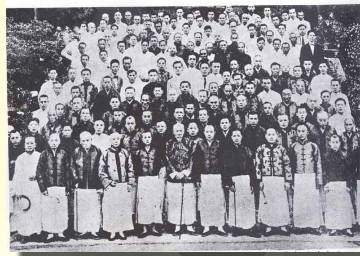
潮州商會第一屆會員大會合照