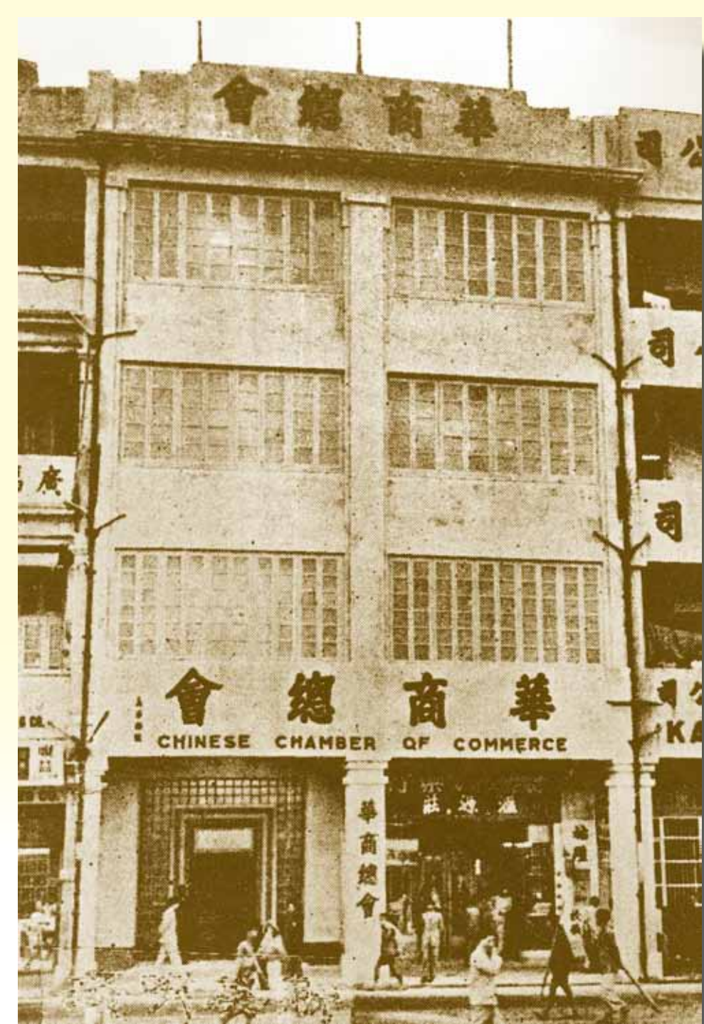
1946 年中總商會 (干諾道中 64-65 號) 外觀