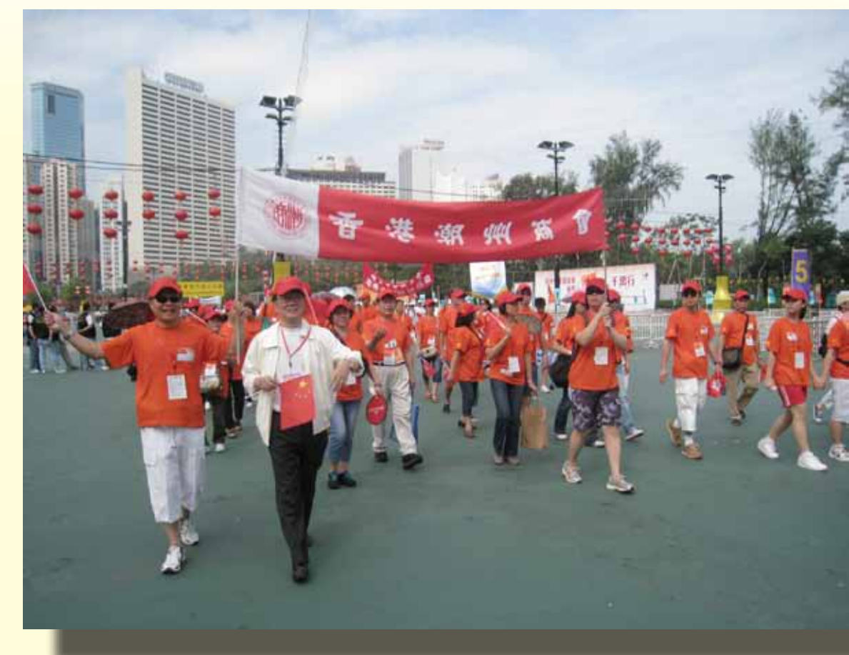
潮州商會參加公益金千萬行