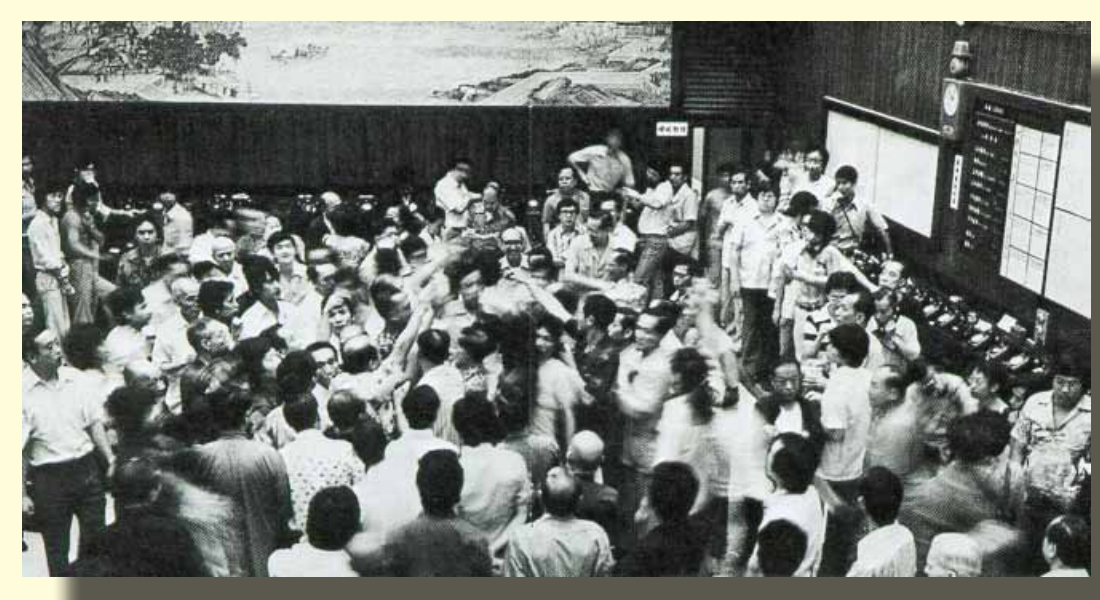
金銀業貿易場交易大堂