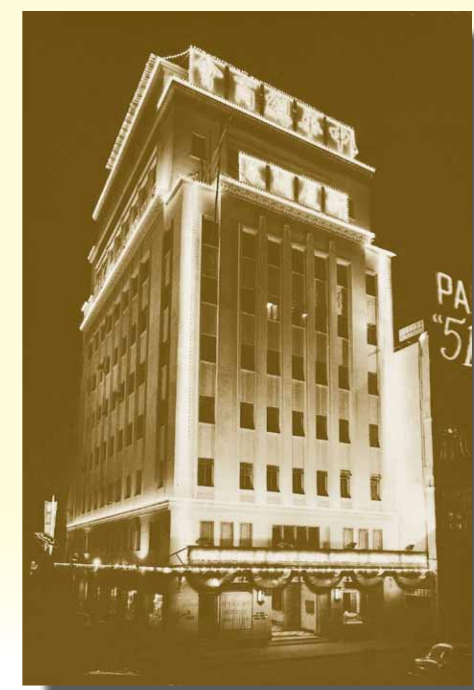
1955 年落成的中華總商會大廈 (干諾道中 24-25 號)，沿用至今。